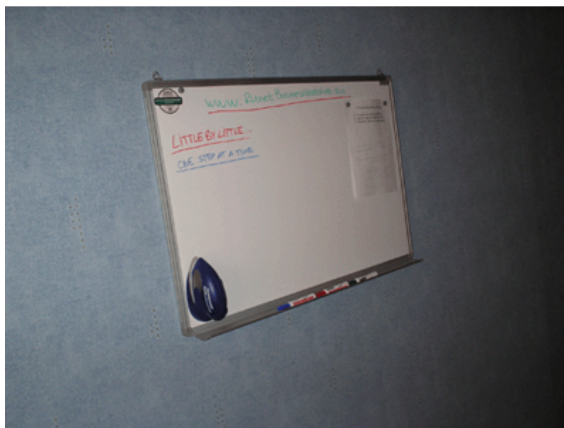
Домашний «уголок мозгового штурма» ☺